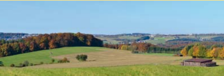
Blick von Rüscheid aus in Richtung Oberhonnefeld